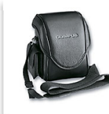
Étui cuir Ref. E0413848