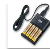
Kit chargeur BU-90 SE Ref. N1453792